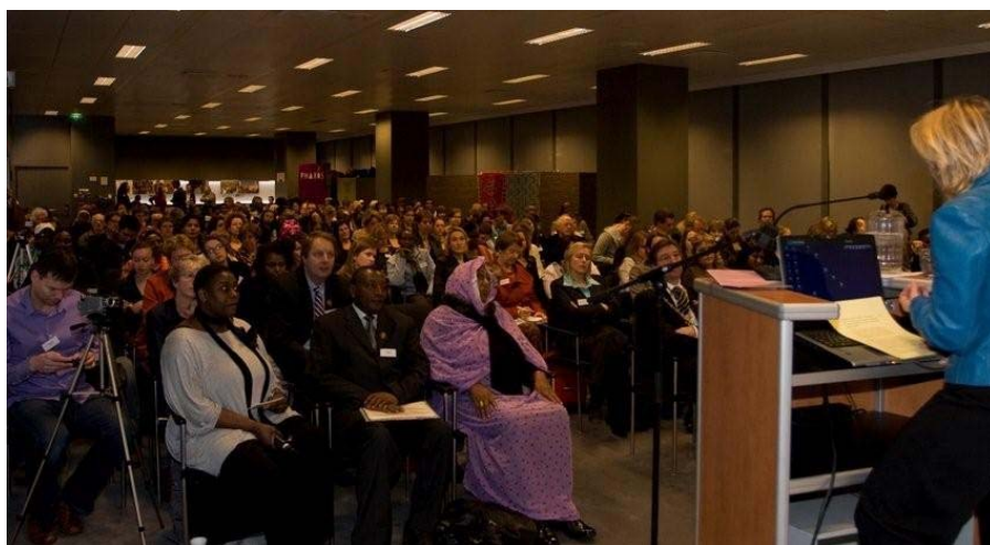
Staatssecretaris Bussemaker spreekt in de Jaarbeurs tijdens Zero Tolerance dag, 6 februari 2009

In haar speech bevestigde zij dat zij niet van plan is om in te stemmen met voorstellen rondom een verplicht lichamelijk onderzoek; de lichamelijke integriteit wil zij niet aantasten. Verder stelde zij: 'Bijzonder is de bijdrage van de sleutelfiguren die in de pilots sterk naar voren komt. Zij verrichten aan de basis belangrijk werk. Ze spreken de taal en begrijpen de cultuur. Zij benaderen gezinnen en meisjes, stellen meisjesbesnijdenis aan de orde en zorgen voor voorlichting. Kortom, zij zijn onmisbaar om dit beladen onderwerp binnen de risicogroepen bespreekbaar te maken'.....en.... 'Een van de conclusies (uit onderzoek, red) is dat de kennis over vgv bij de AMK's (advies- en meldpuntkinder mishandeling, red) en de Raad voor de Kinderbescherming beter kan. Met name de kennis over risicolanden, de vormen van vgv, de leeftijd waarop het gebeurt en de strafbaarheid moet worden uitgebreid'. Voor volledige tekst – zie bijlage.