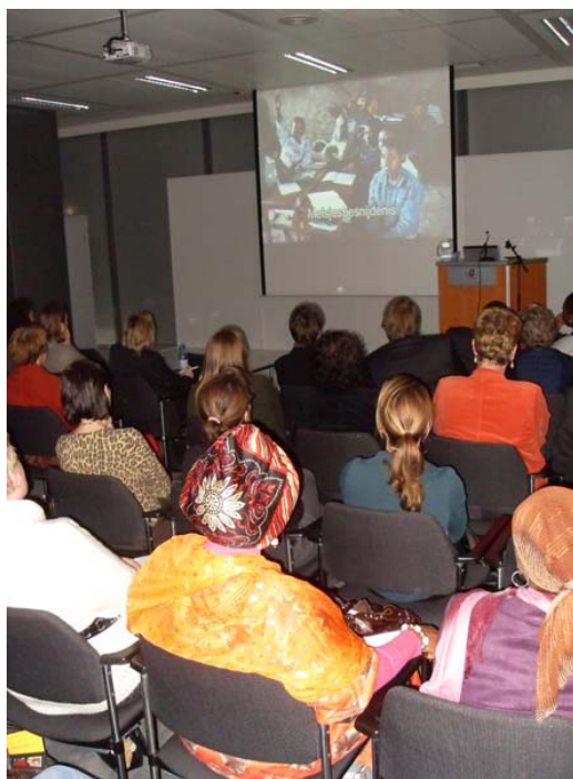
Het bekijken van de première van de film 'My sis will be safe'.

Waarom zijn jongeren niet actief m.b.t. activiteiten in de landen van herkomst? VGV is een thema waarop veel werk te doen is, en veel uitdaging ligt, m.n. als het gaat om de link tussen jongeren hier en jongeren in de landen van herkomst.