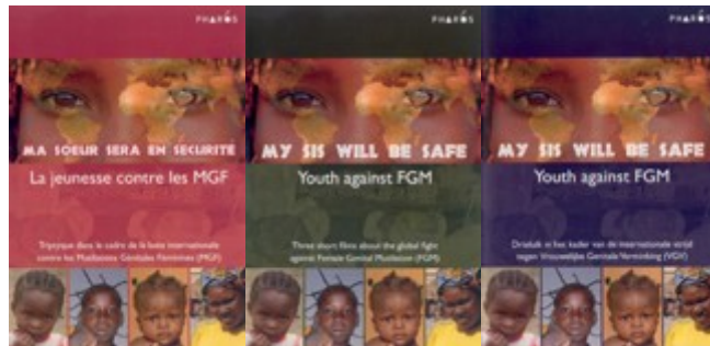
Voorkant van de Franse, Engelse en Nederlandse versie van de dvd 'My sis will be safe'